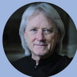
CARL ST.CLAIR conductor