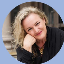
LIGIA AMADIO conductor

A PROGRAM FULL OF ENERGY, PASSION, AND FATE