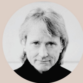
CARL ST.CLAIR conductor